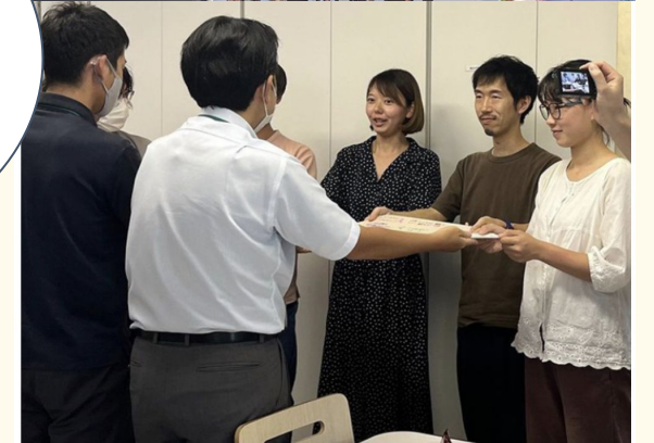
国立市にエールアクションの署名や寄せ書きを手渡した（2023年9月）