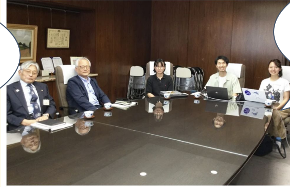
市長との面談の様子（2023年5月18日）

国立市在住の女性。 はじめはたった一人。 市の環境審議会委員に応募！ 委員として62%削減を求め、 計画案の中で選択肢に。